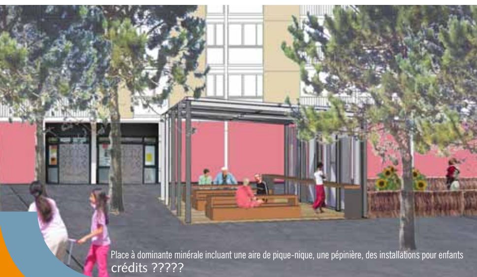
Place à dominante minérale incluant une aire de pique-nique, une pépinière, des installations pour enfants crédits ?????

Les travaux représentent un investissement de l'ordre de trois millions d'euros , pris en charge, pour une grande partie, par l'opération de renouvellement urbain (ORU). Ils n'auront pas de répercussion sur les loyers. (à valider) ■