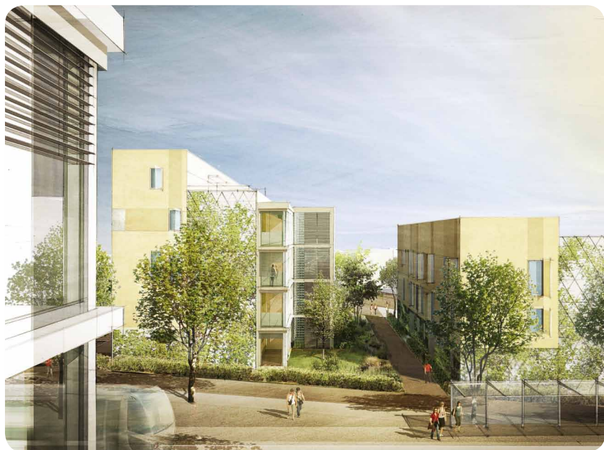
Jardins en cours d'aménagement.